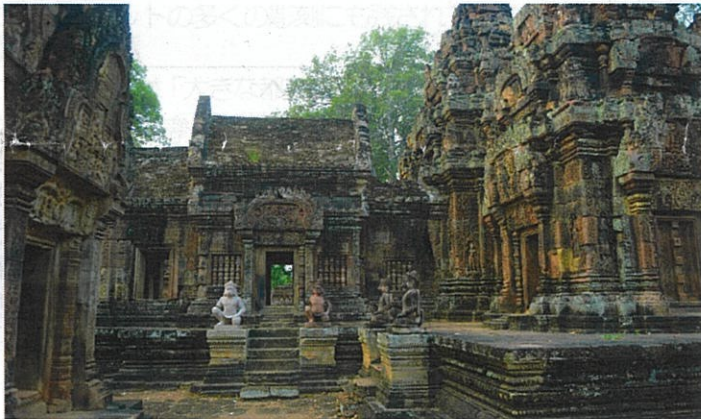
バンテアイ・スレイ