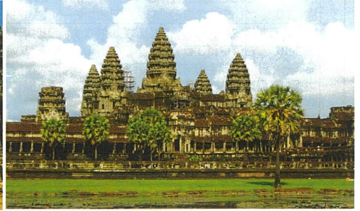
アンコール・ワット